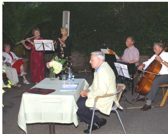
Das Wormser Instrumentalquartett „Andantino“